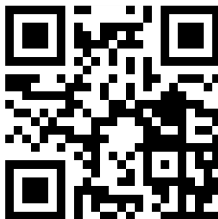
รูปที่ ๑ - ๒ วิดีโอประกอบการใช้สื่อคอสเพลย์การ์ตูนเด็กส่งเสริมการแปร่งฟันจากนิทานเรื่องคุณฟองน้กแปร่งฟัน