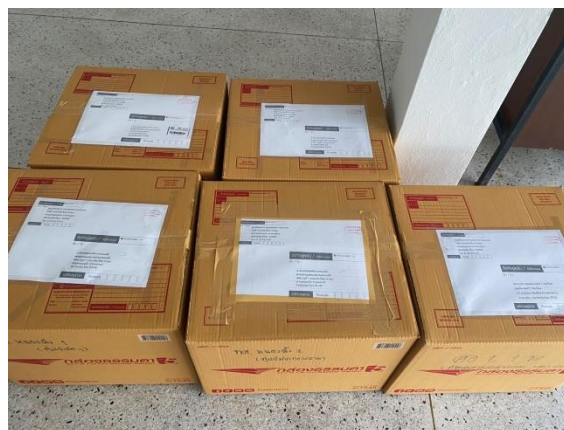
รูปที่ ๓-๔ การส่งมอบสื่อคอสเพลย์การ์ตูนเด็กส่งเสริมการแปร่งฟันจากนิทานเรื่องคุณฟองน้กแปร่งฟัน แก่พื้นที่ภาคีเครือข่าย