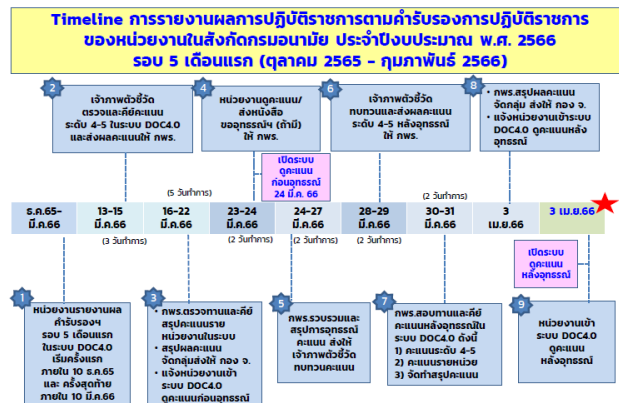
เอกสารการประเมินเชิงปฏิบัติการ เรื่อง การกำหนดและชี้แจงเกณฑ์ประเมินตัวชี้วัด ตามคำรับรองการปฏิบัติราชการของหน่วยงานในสังกัดกรมอนามัย ประจำปีงบประมาณ พ.ศ. ๒๕๖๖

Timeline การรายงานผลการปฏิบัติราชการตามคำรับรองการปฏิบัติราชการของหน่วยงานในสังกัดกรมอนามัย ประจำปีงบประมาณ พ.ศ. ๒๕๖๖ รอบ ๕ เดือนแรก (ตุลาคม ๒๕๖๕ - กุมภาพันธ์ ๒๕๖๖)